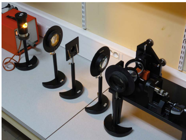
Figure 1 - Dispositif expérimental, utilisant (de gauche à droite) une lampe à vapeur de sodium, un condenseur formant l'image de son ampoule sur un diaphragme à iris servant de sténopé réglable, une lentille collimatrice ( L_C ), l'interféromètre de Michelson avec une lame de verre (juchée sur un support rouge) devant la moitié droite du miroir ( M_2 ) et à peu près parallèle à lui, et à la sortie de l'interféromètre la lentille ( L_S ) de 20 cm de focale comme ( L_C ).

Pour contribuer à former l'image réelle ( I_{RL} ) de ( \pi ), on place à la sortie de l'interféromètre une dernière lentille convergente ( L_S ) de 20 cm de focale (cf. figure 1). Celle-ci peut servir, lors d'une séance avec un groupe d'étudiants, à projeter l'image agrandie ( I_{RL} ) sur un écran, où on observera collectivement les franges et où on fera des mesures de l'interfrange : en l'absence de lame, il vaudra I \cong |\gamma| \frac{\lambda}{2|\alpha|} où \gamma désigne le grandissement négatif de ( \pi ) à ( I_{RL} ), qu'on estimera en faisant le rapport des distances de ( L_S ) à ( I_{RL} ) et de ( L_S ) à ( \pi ). Compte tenu de la présence du sténopé, l'observation sera assez peu lumineuse et il faudra se mettre dans une pièce bien noire. Mais en rapprochant ( L_S ) de la sortie de l'interféromètre, on peut aussi former grâce à cette lentille une image droite de ( \pi ), virtuelle, agrandie et située à une distance confortable, qui pourra être observée individuellement – l'image finale réelle ( I_{RL} ) étant alors formée sur la rétine de l'œil de l'observateur, ou bien sur le capteur d'image d'un appareil photographique, selon la technique classique d'observation d'une image aérienne (expliquée par exemple à propos d'une autre expérience [8] où elle sert abondamment). Une des figures d'interférences obtenues est montrée sur la figure 2 (cf. page ci-contre).