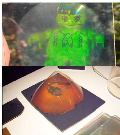
Fig. 4 : 2 exemples d'hologrammes. Le premier a été fait lors d'un atelier avec un groupe de collégiens à l'ESCUP alors que le deuxième, un peu plus délicat à réussir, a été réalisé par un étudiant du projet holographie en licence 1 ère année.

En conclusion, lorsque j'ai commencé à m'intéresser à l'holographie, les livres que j'ai lus ont trop souvent insisté sur la quasi-impossibilité de réussir ce type d'expérience sans un matériel de recherche haut de gamme. J'ai donc présenté dans cet article comment il est possible de réaliser des hologrammes avec du matériel assez simple dans différents champs du savoir : enseignement en licence fondamentale, en master professionnel, diffusion scientifique et formation continue. Une démonstration de réalisation d'hologrammes complètera ce texte lors de la conférence.