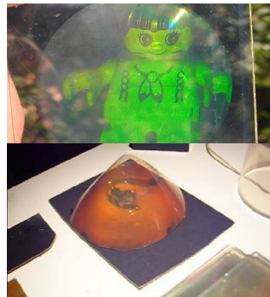
Fig. 4 : 2 exemples d'hologrammes. Le premier a été fait lors d'un atelier avec un groupe de collégiens à l'ESCUP alors que le deuxième, un peu plus délicat à réussir, a été réalisé par un étudiant du projet holographie en licence 1 ère année.

En conclusion, lorsque j'ai commencé à m'intéresser à l'holographie, les livres que j'ai lus ont trop souvent insisté sur la quasi-impossibilité de réussir ce type d'expérience sans un matériel de recherche haut de gamme. J'ai donc présenté dans cet article comment il est possible de réaliser des hologrammes avec du matériel assez simple dans différents champs du savoir : enseignement en licence fondamentale, en master professionnel, diffusion scientifique et formation continue. Une démonstration de réalisation d'hologrammes complètera ce texte lors de la conférence.